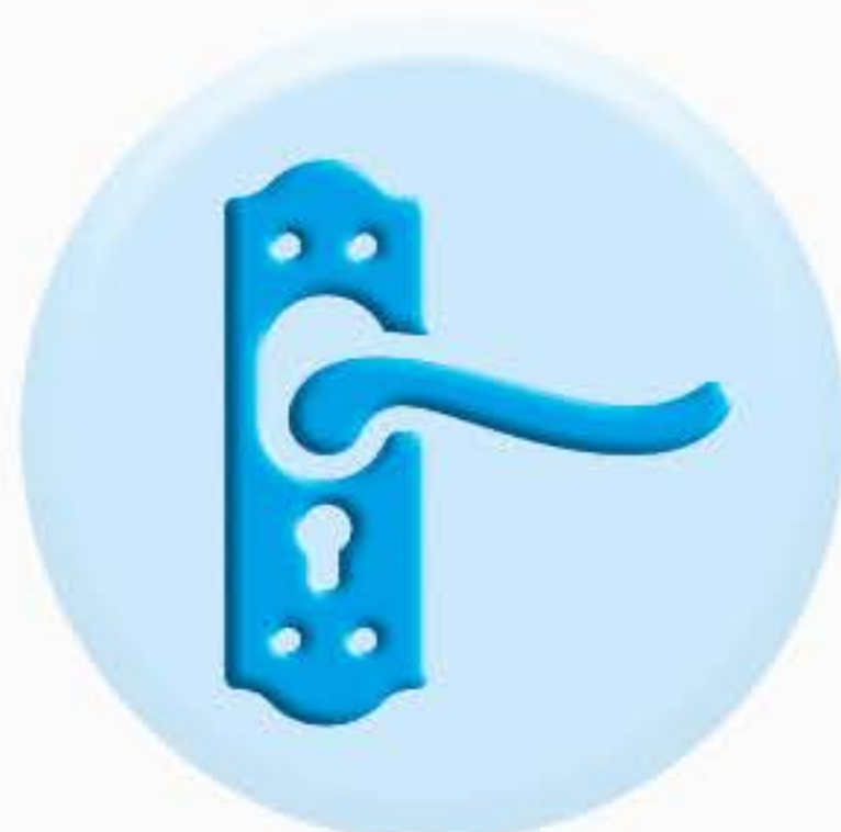
РУЧКИ ДВЕРЕЙ И ШКАФОВ

ТО, К ЧЕМУ МЫ ПРИКАСАЕМСЯ ЧАЩЕ ВСЕГО ДОЛЖНО БЫТЬ ЧИСТЫМ