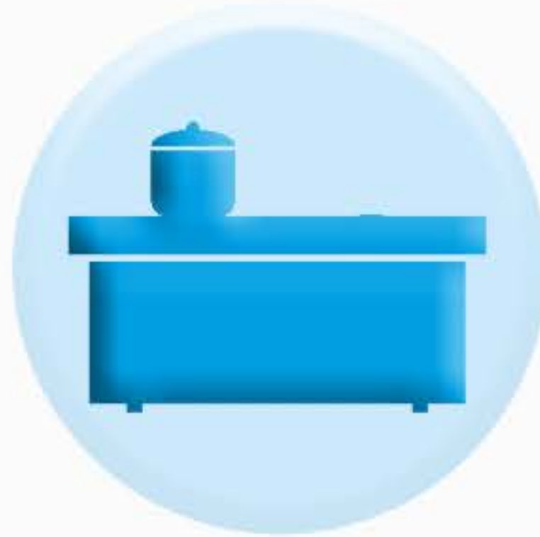
ПОВЕРХНОСТИ СТОЛЕШНИЦ, ПОЛОК