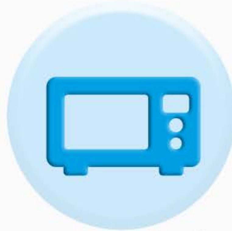
ПАНЕЛИ БЫТОВОЙ ТЕХНИКИ