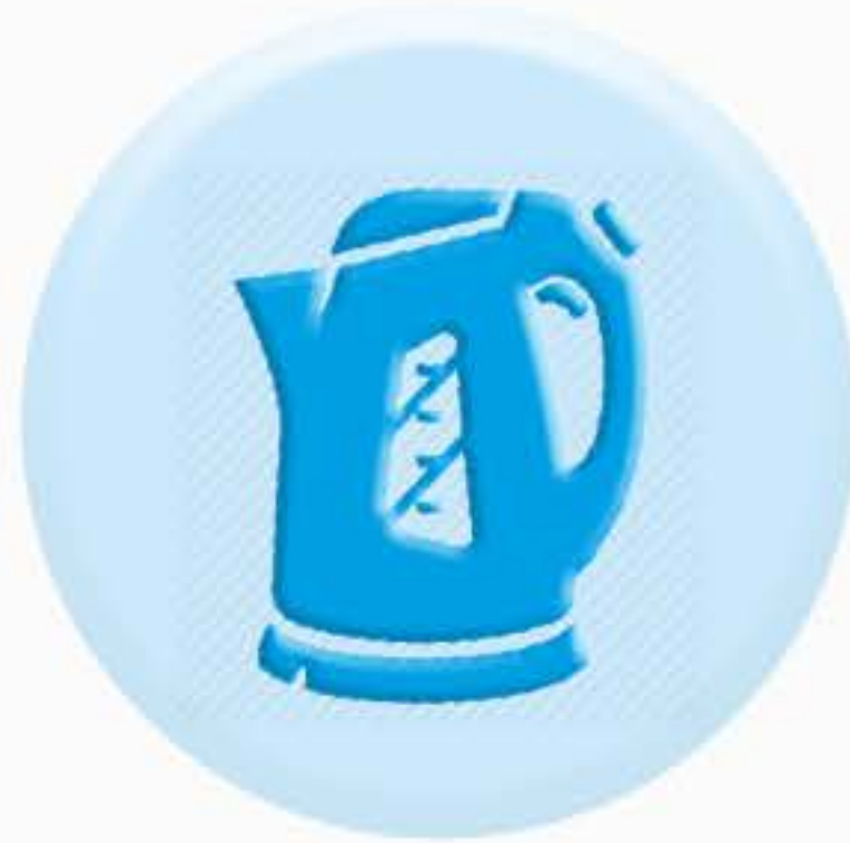
КНОПКИ БЫТОВЫХ ПРИБОРОВ