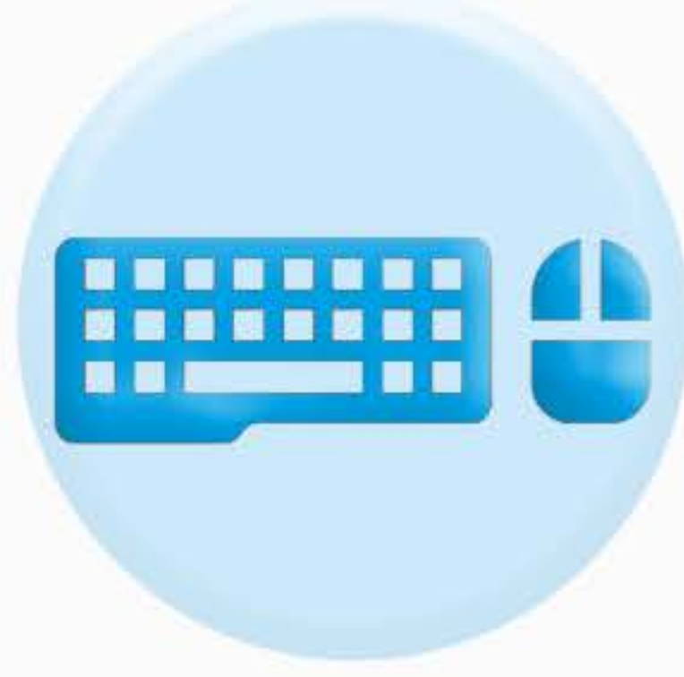
КЛАВИАТУРА ОРГТЕХНИКИ И МЫШКА