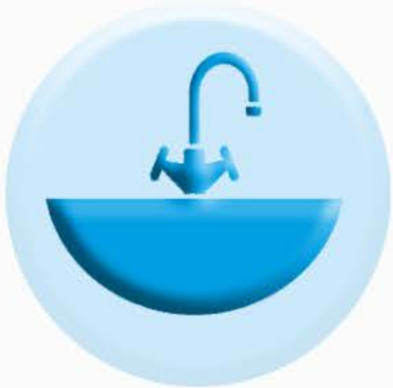
РАКОВИНЫ И СМЕСИТЕЛИ